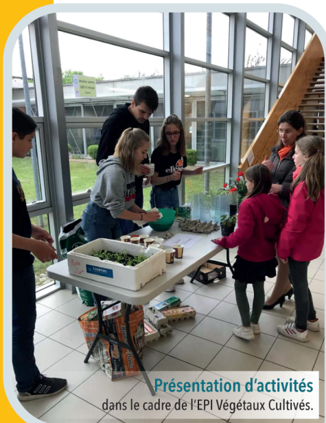
Présentation d'activités dans le cadre de l'EPI Végétaux Cultivés.