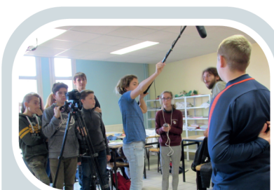
Entraînement en vue du tournage d'une scène d'un court métrage dans le cadre d'un projet PEPS proposé par le conseil régional des hauts de France.